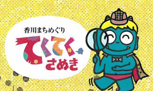
香川まめぐり てくてく さめき