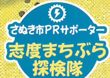
志度まちぶら 探検隊